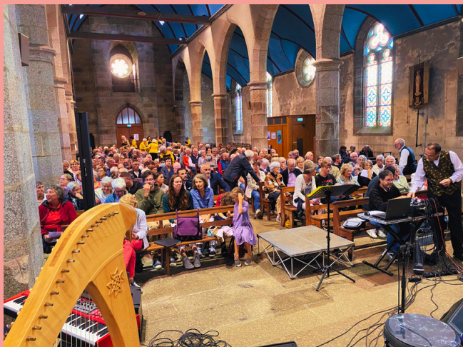
Samedi 12 août, l'ensemble choral du bout du monde s'est produit devant environ 200 personnes dans l'église de Plouguin !