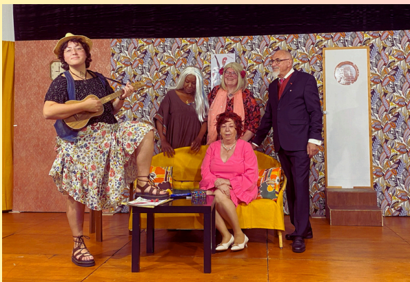
La troupe Aber Théâtre après sa prestation devant une cinquantaine de personnes le 23 juin