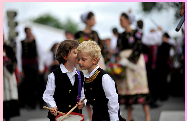
Merci à Pascal Jaugeon pour son exposition sur l'identité bretonne durant le mois de juin