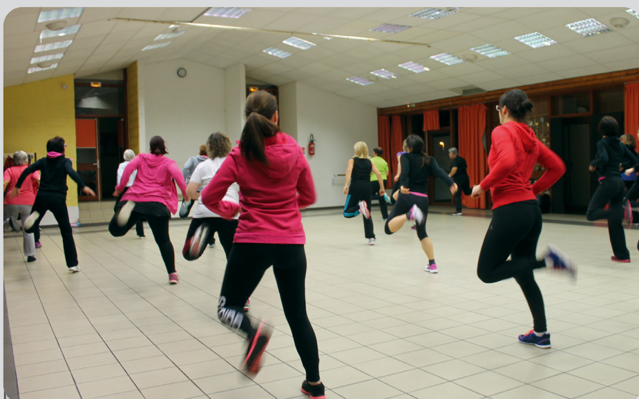
Cours de fitness