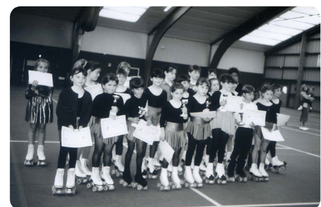
1997 - Coupe départementale Club Patiner à Plouguin