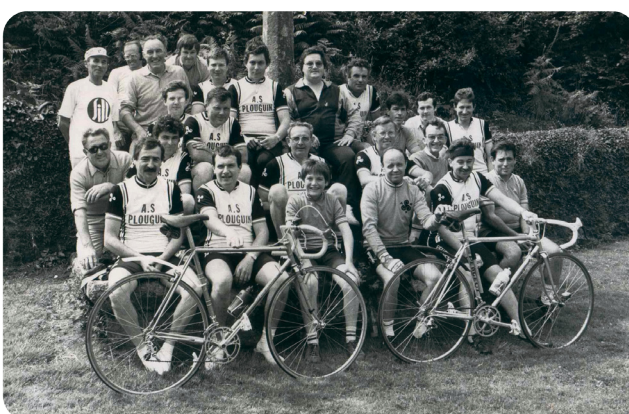
Années 80 - ASP Section vélo